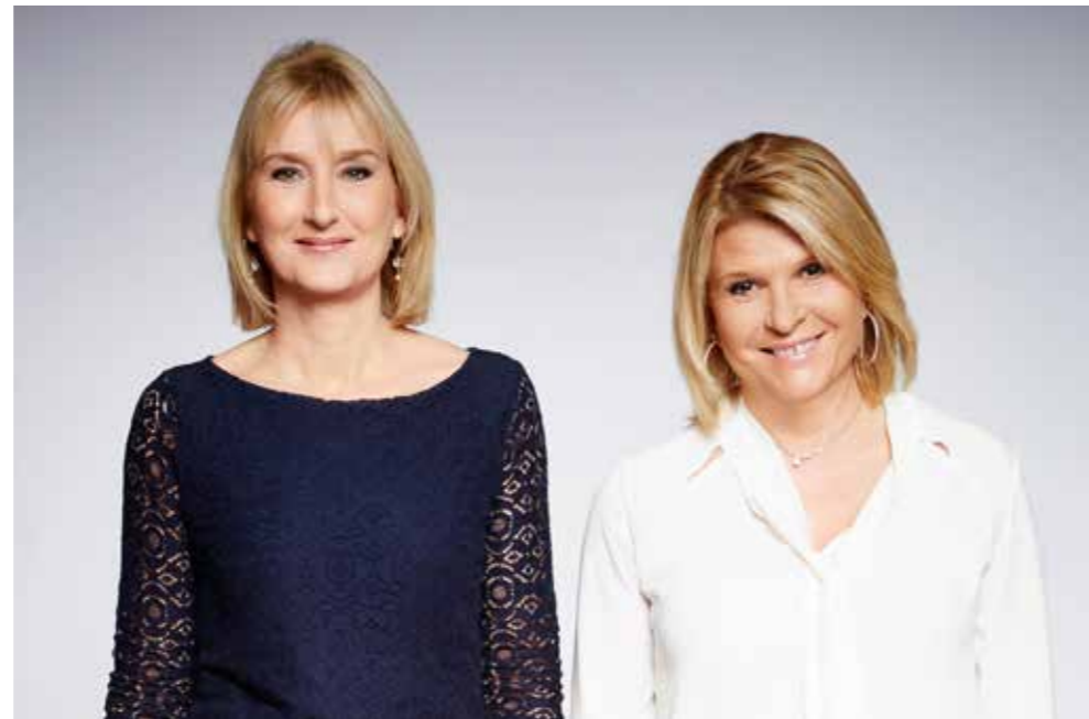
AU COEUR DE NOS DIFFÉRENCES