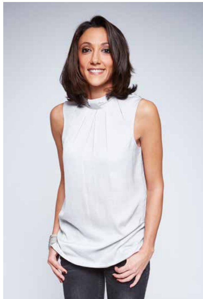
LE JOUR OÙ