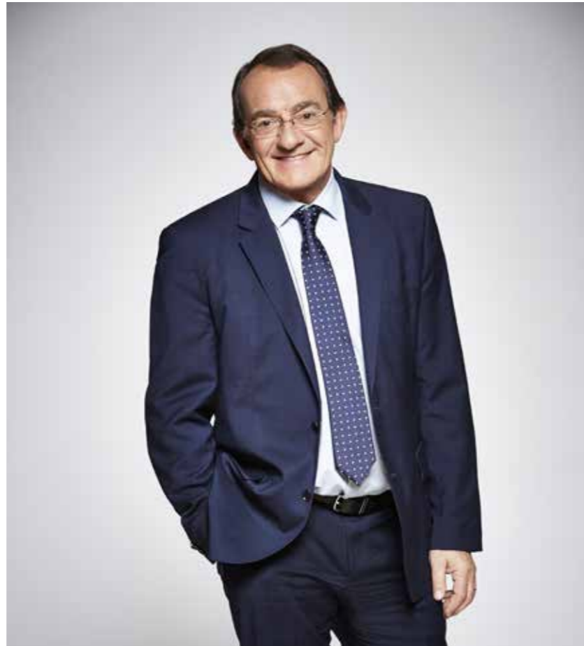
AU COEUR DES REGIONS