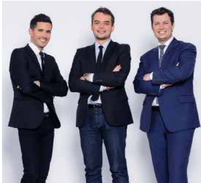
AU COEUR DE LA COURSE