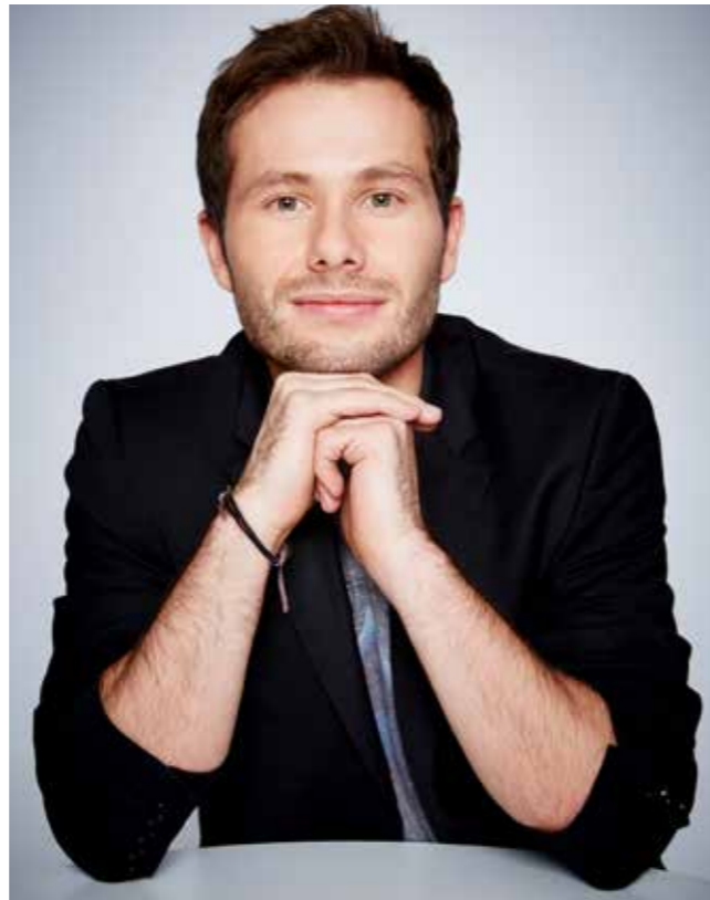
LE PETIT JT