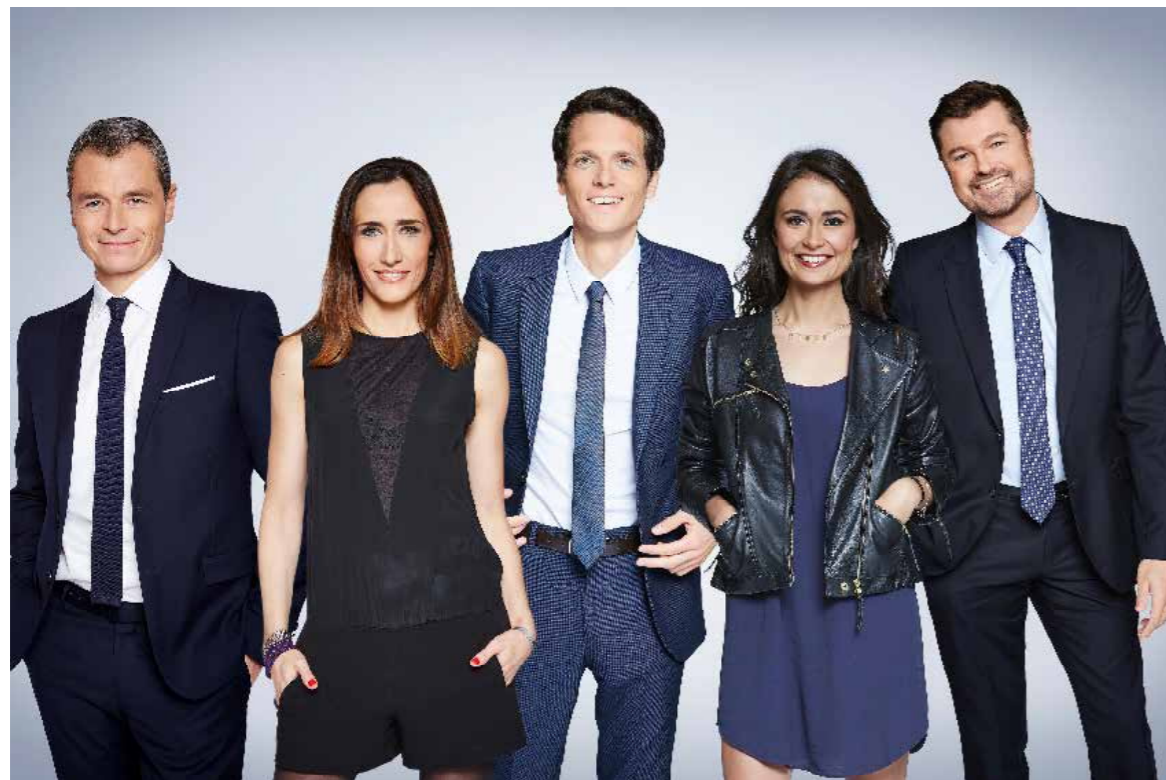
ÉDITIONS DU WEEK-END