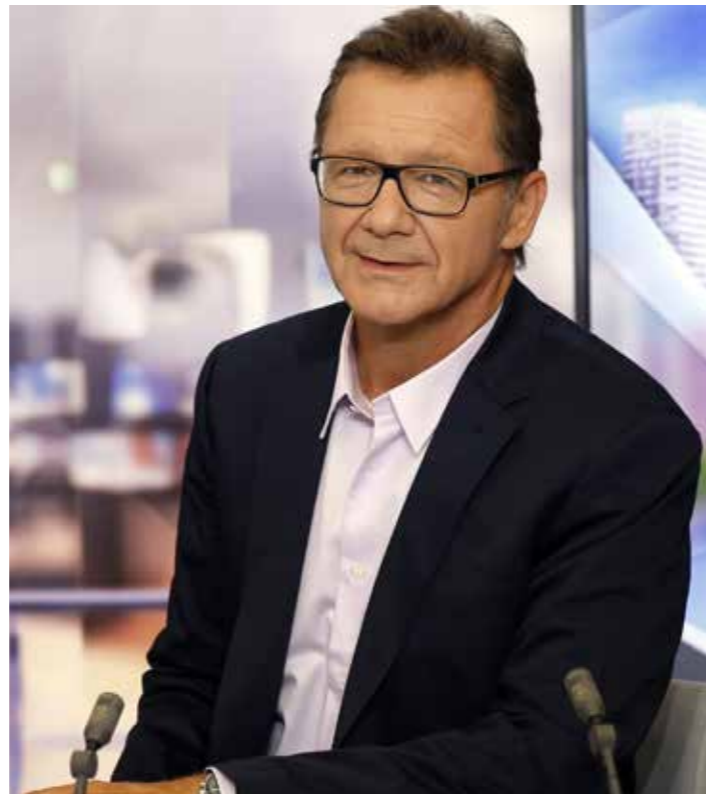
LE CLUB DE L'ÉCONOMIE