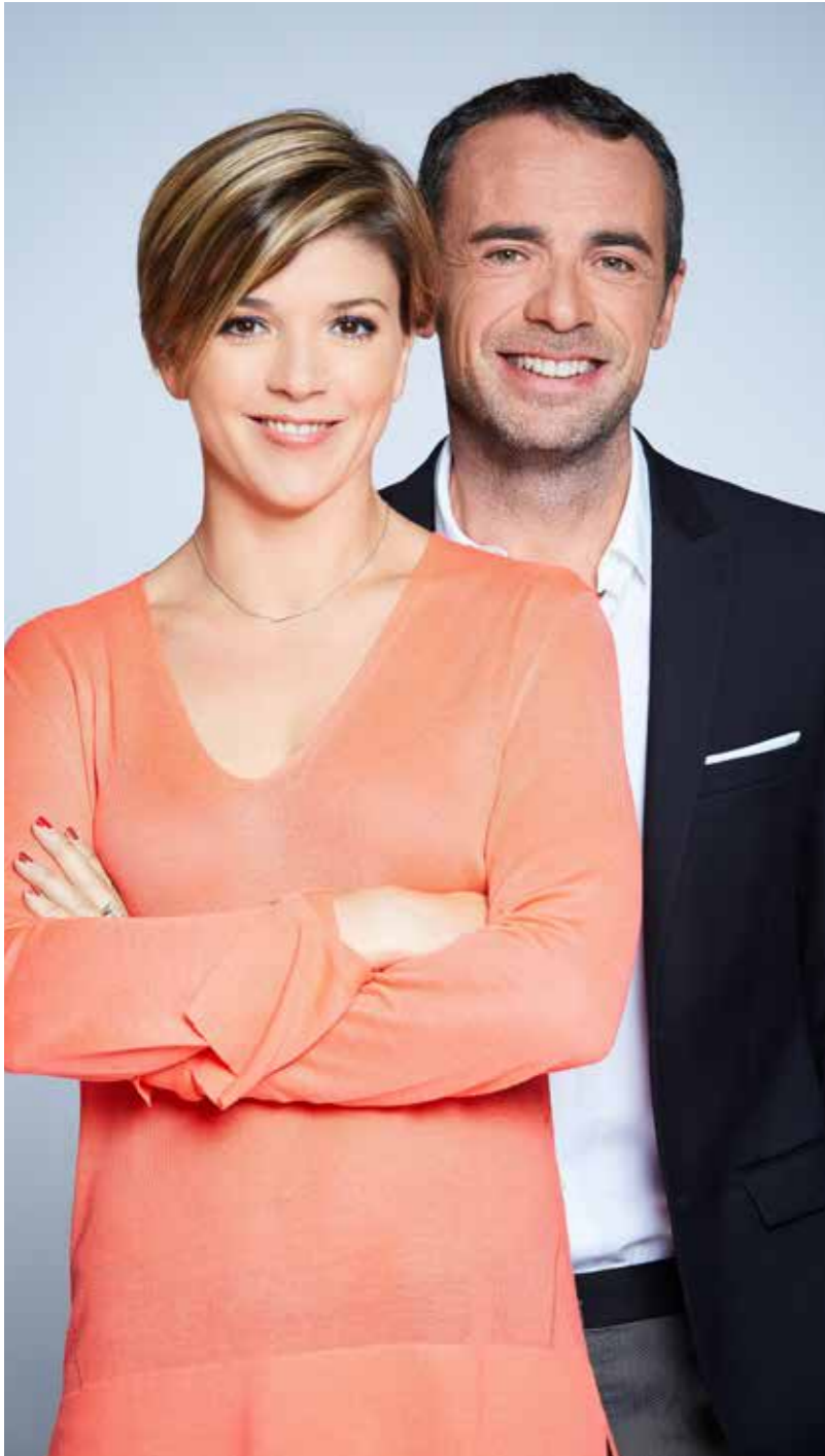
LCI ET VOUS