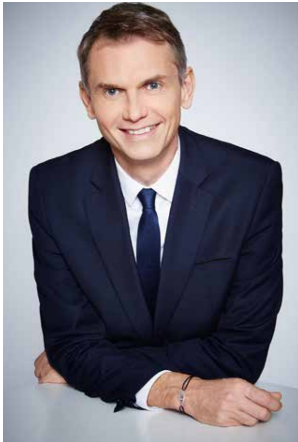
BUREAU POLITIQUE LE GRAND JURY LCI - RTL - LE FIGARO