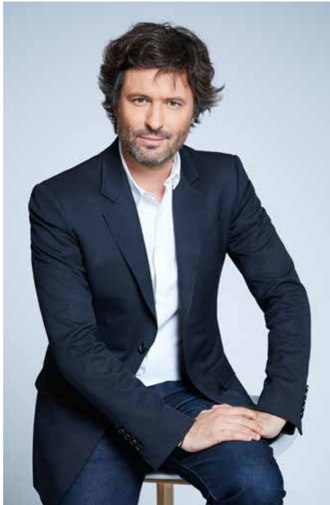
AU FIL DES MOTS