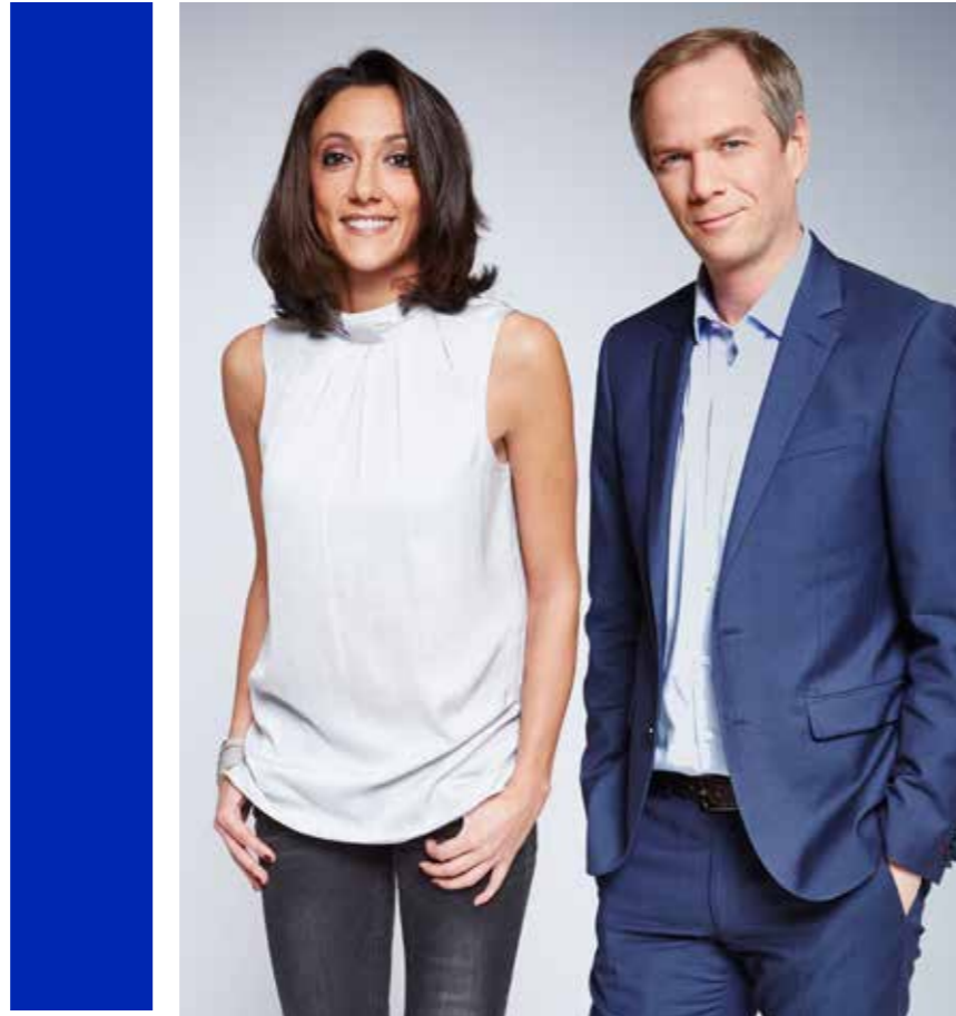
LE GRAND SOIR