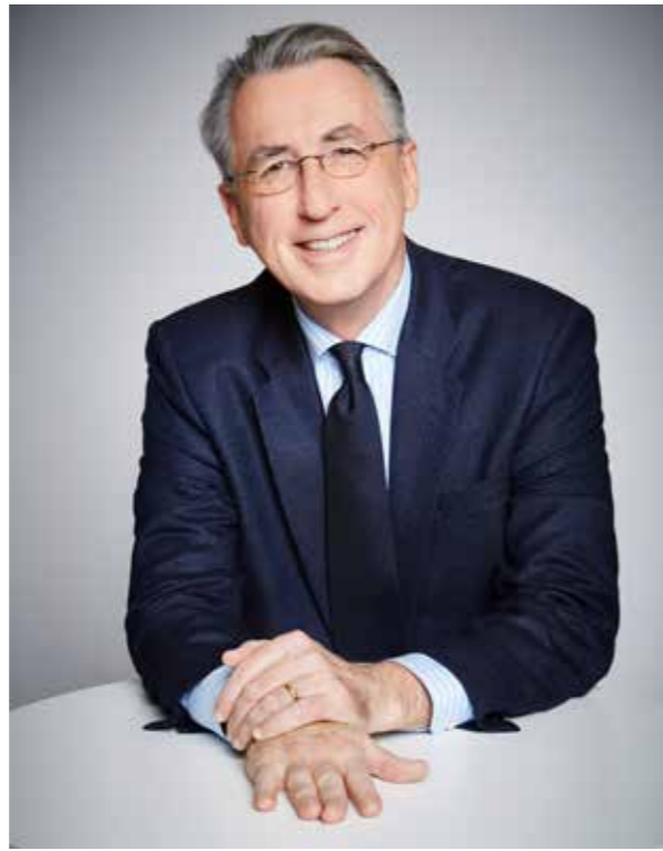
TOUT UN MONDE LE MONDE À REBOURS