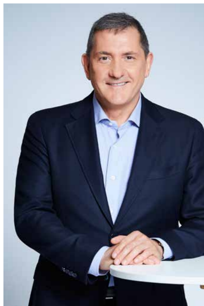
24 HEURES EN QUESTIONS