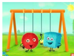
Rosy et Fuzz