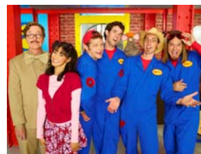
Les Zic' Magines