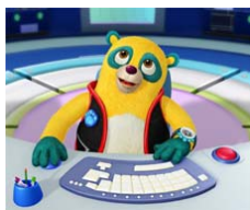
Agent Spécial Oso