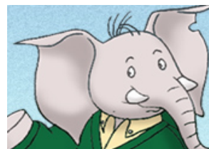
La Famille Trompette