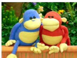
Ooh & Aah