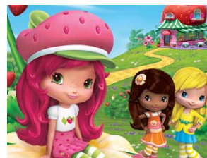
Charlotte aux fraises