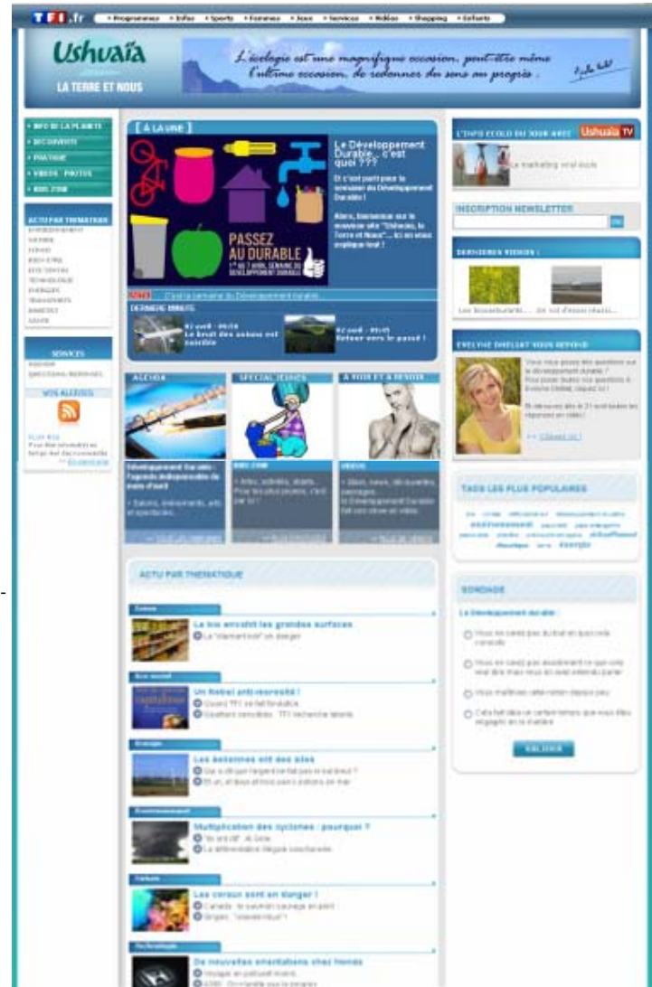
La Home Page de «Ushuaia, la Terre et Nous» - visuel non contractuel