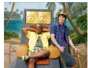
Paire de Rois