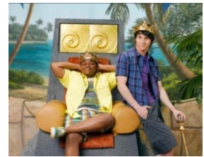
Paire de Rois