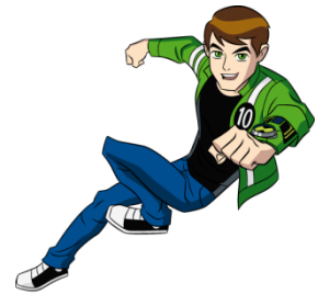
Ben10 Ultimate Alien

32 messages autour des programmes préférés des garçons: Ben10, Scooby Doo, Gumball..