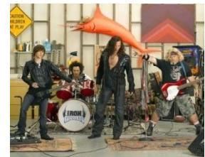
I'm in the band