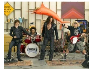
I'm in the band