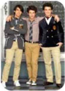
Les Jonas Brothers