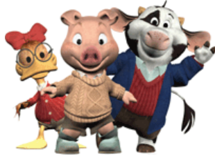
Piggy et ses amis