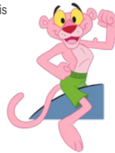
La panthère rose et ses amis