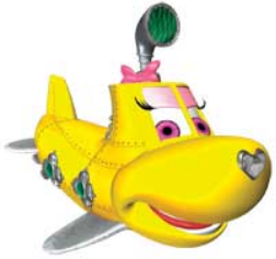
Plouf Oly Plouf