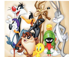
The looney tunes show