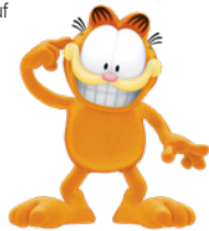
Garfield et Cie