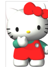
Hello Kitty et ses amis