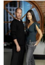
PREUVE A L'APPUI