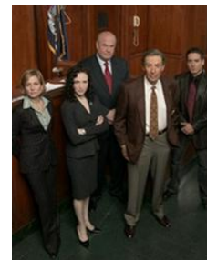
NEW YORK COUR DE JUSTICE