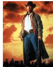
WALKER TEXAS RANGER