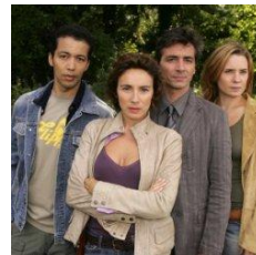
DIANE FEMME FLIC