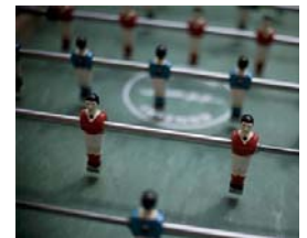
Coupe du Monde babyfoot