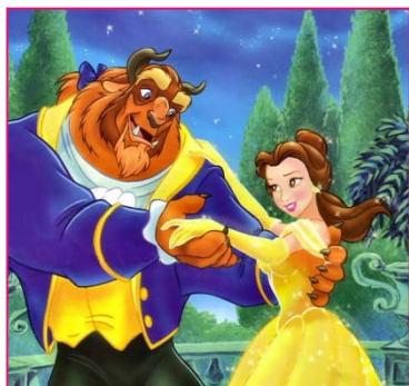
La belle et la bête