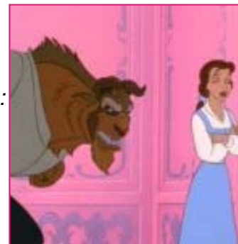
Le monde magique de la belle et la bête