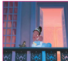
La Princesse et la Grenouille