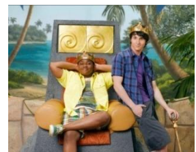
Paire de Rois