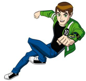
Ben10 Ultimate Alien

32 messages autour des programmes préférés des garçons : Ben10, Scooby Doo, Bakugan, Adventure Time, Gumball..